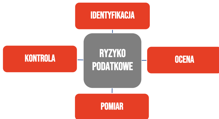
Schemat 2. Metodyka zarządzania ryzykiem podatkowym

Same działania Spółki związane z zarządzaniem ryzykiem podatków można podzielić na cztery zasadnicze etapy: